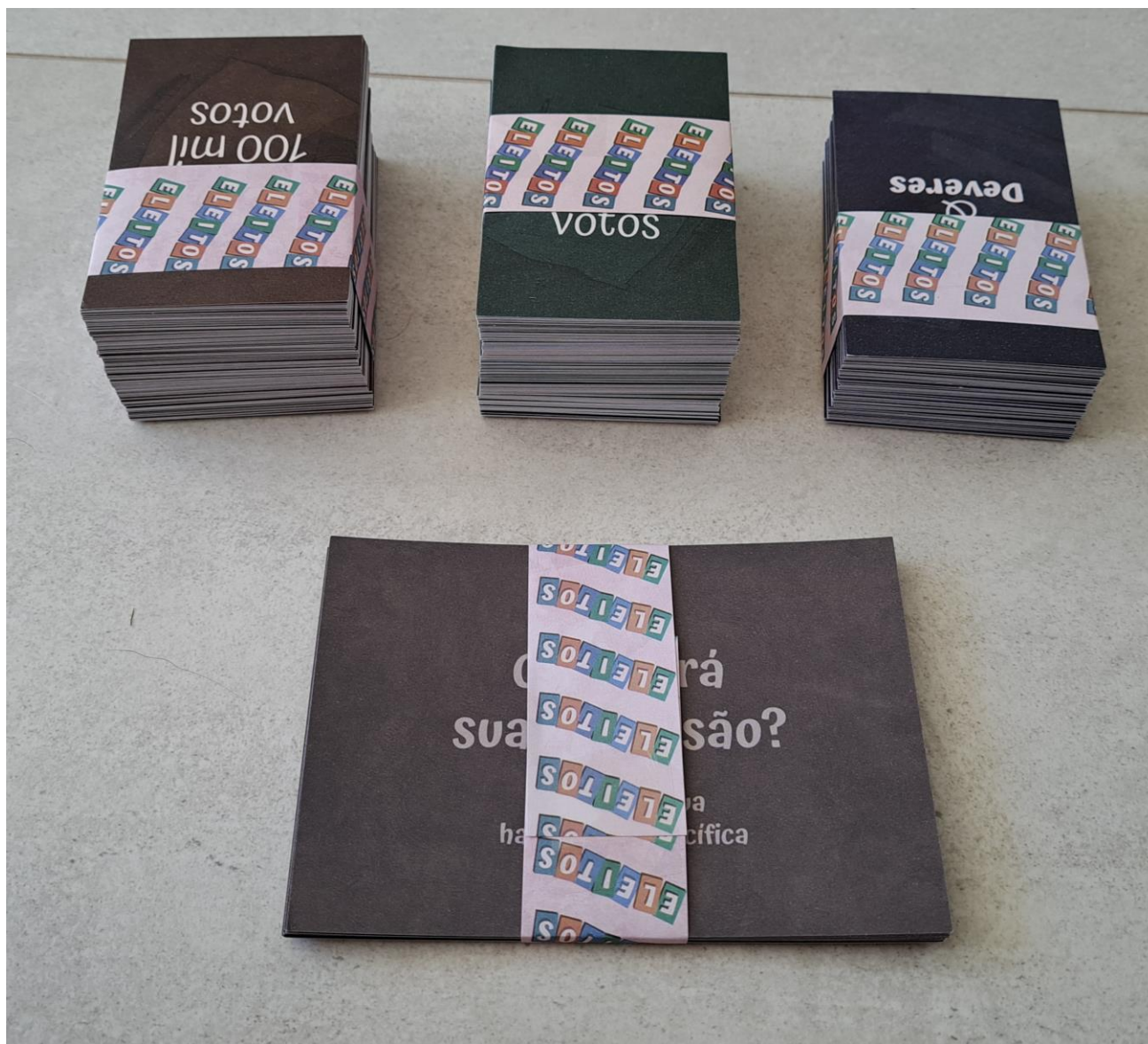
Cartas modelo 1 e 2