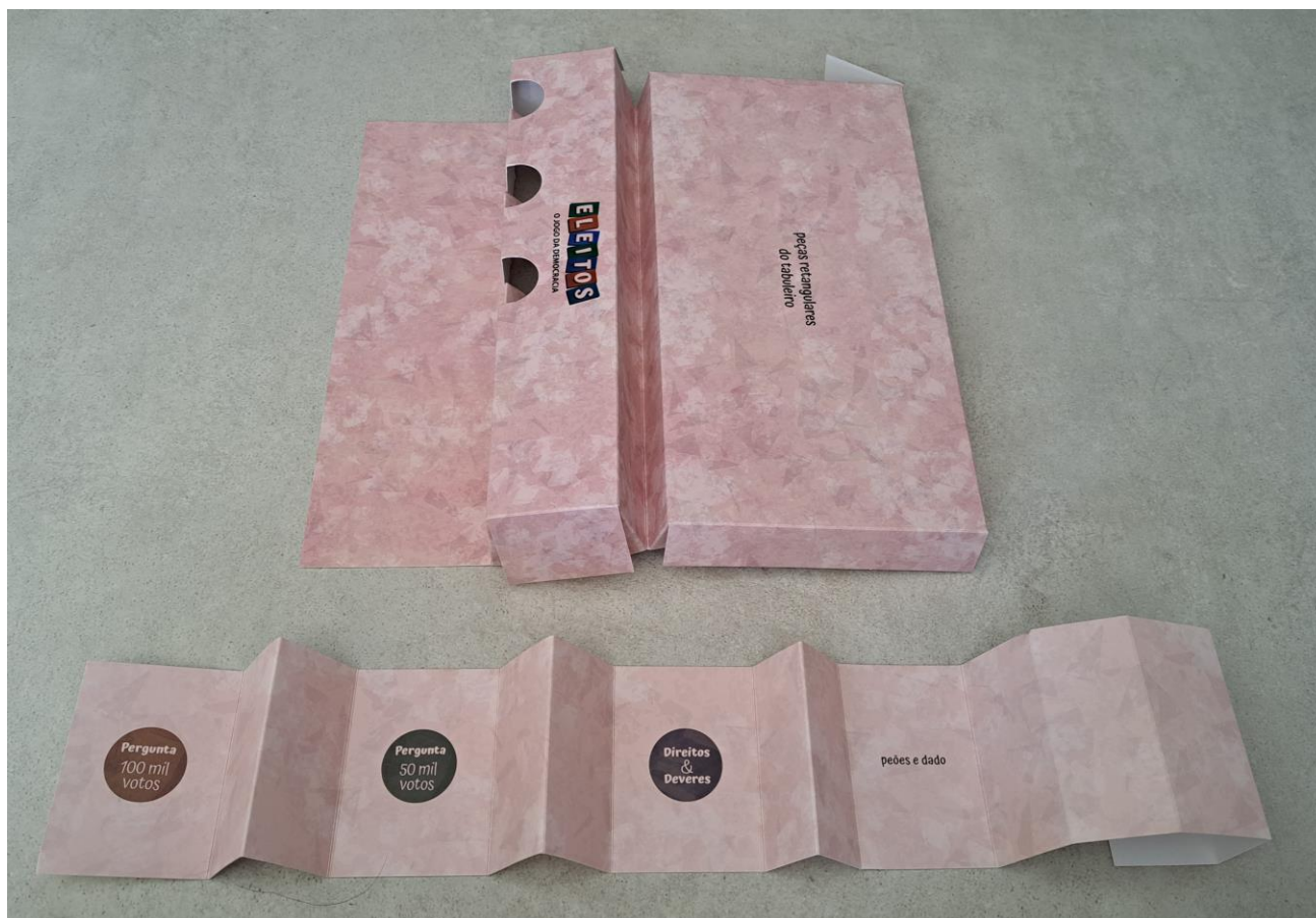
Divisórias internas (vista explodida)