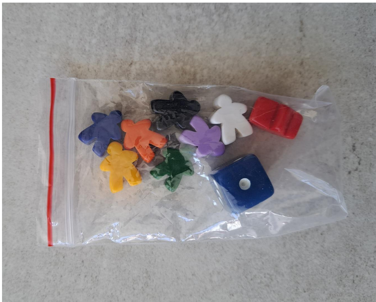
Dados e peões