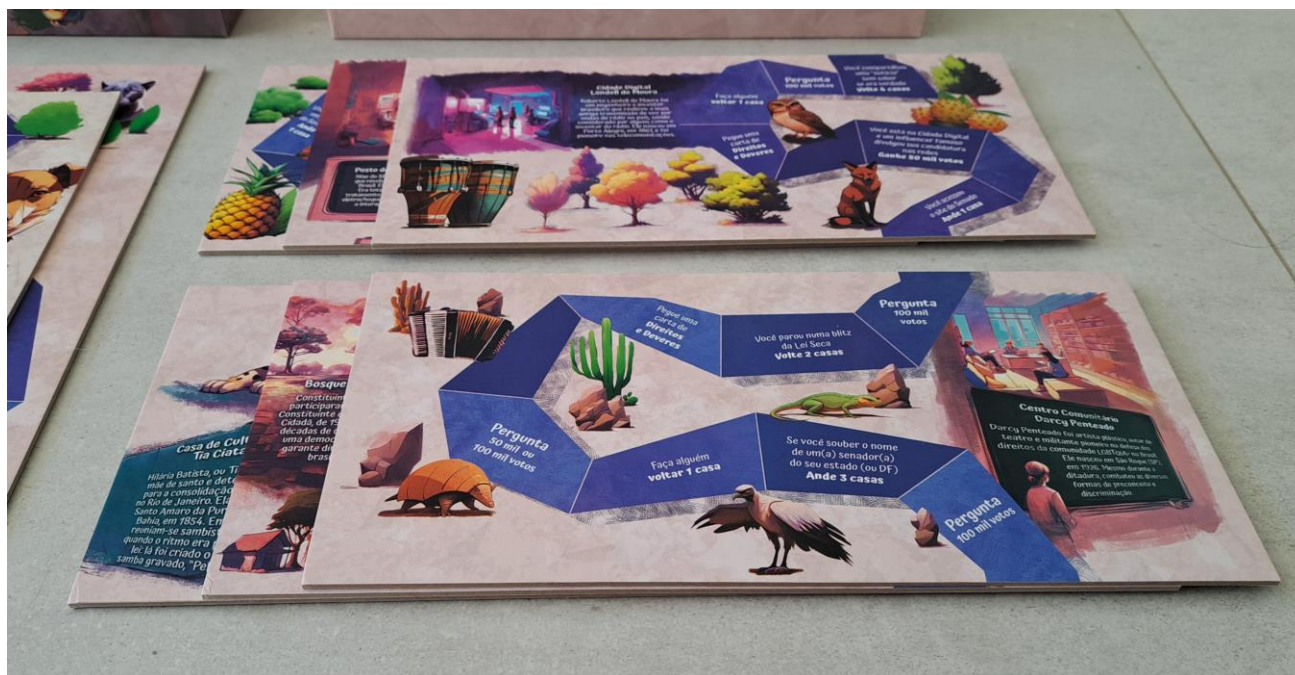
6 tabuleiros pequenos