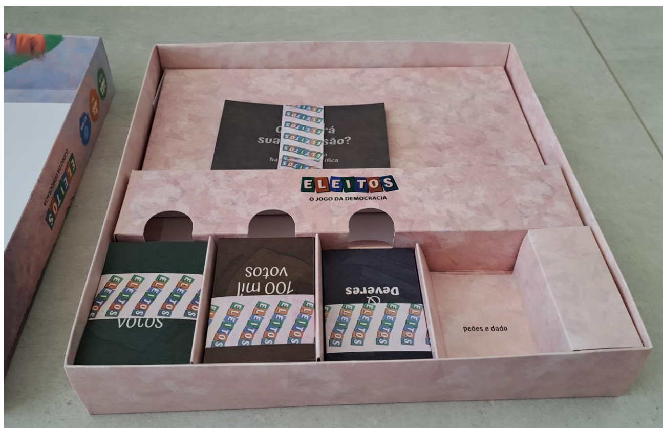
Caixa base e divisórias internas